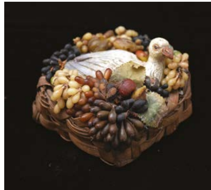
84 Cestino con uva in cera e colomba in terracotta policroma cm 8x8 Napoli XVIII - XIX secolo Stima: € 400/500