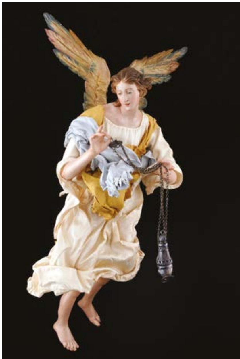
5 Angelo h cm 33 accessori: incensiere Napoli XVIII - XIX secolo Stima: € 3.000/4.000