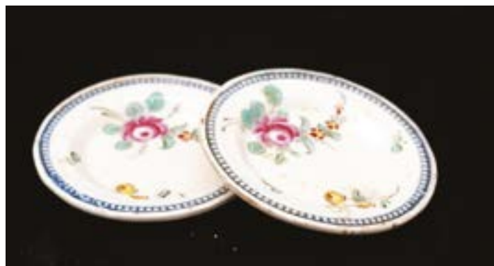
83 Coppia di piatti cm 7 Napoli XVIII - XIX secolo Stima: € 150/200