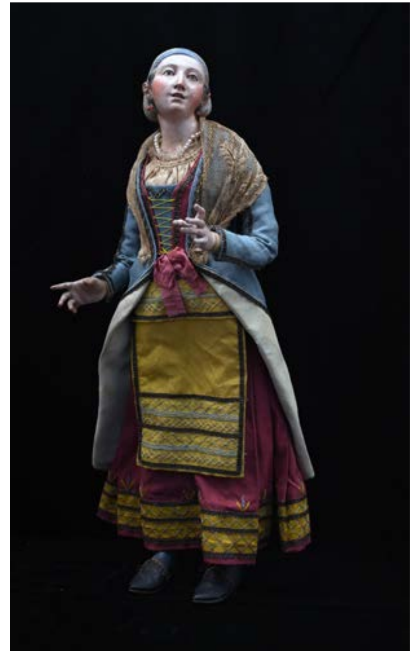
52 Procidana h cm 39 accessori: collana e orecchini in corallo Napoli XVIII - XIX secolo Stima: € 2.400/3.600