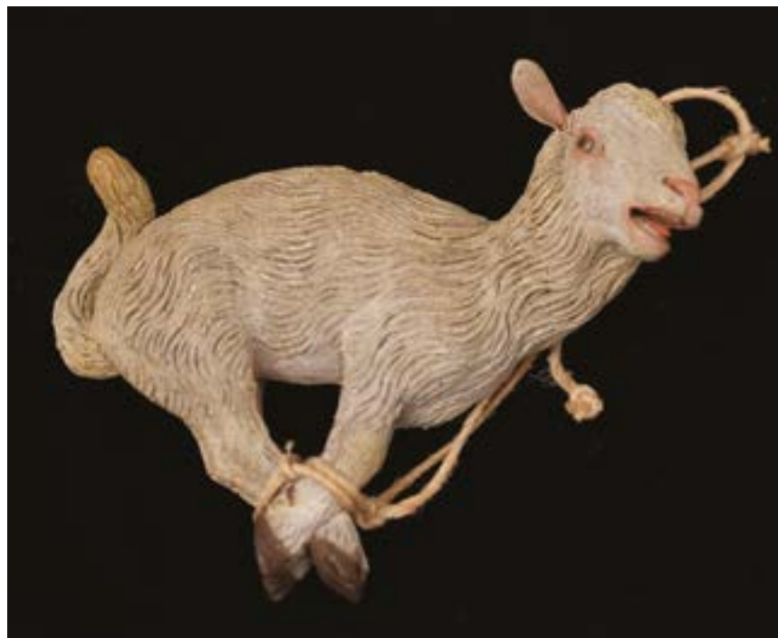
82 Agnello legato in terracotta policroma cm 7x9 Napoli XVIII - XIX secolo Stima: € 700/900