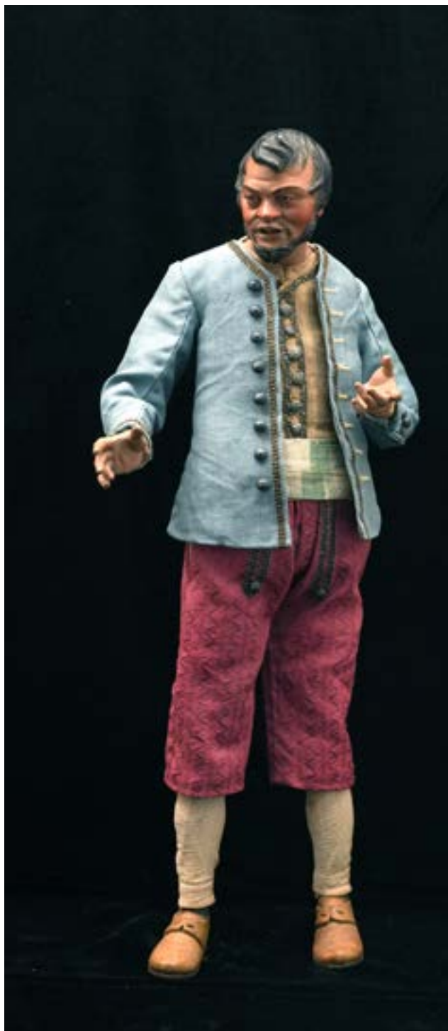
53 Villano ricco h cm 38 Napoli XVIII - XIX secolo Stima: € 2.000/3.000