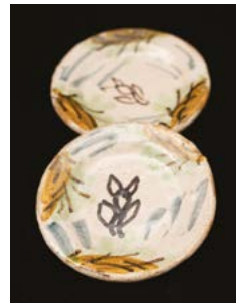
85 Coppia di piatti cm 5,8 Napoli XVIII - XIX secolo Stima: € 150/200