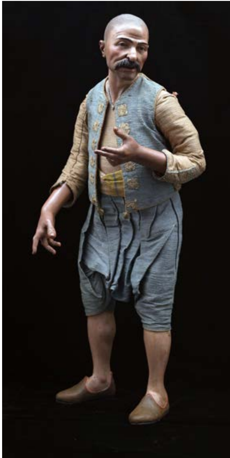
51 Orientale h cm 43 Napoli XVIII - XIX secolo Stima: € 2.000/3.000