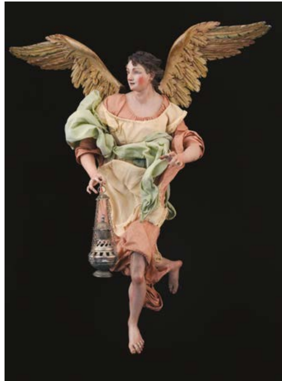
6 Angelo h cm 38 accessori: incensiere Napoli XVIII - XIX secolo Stima: € 4.000/6.000