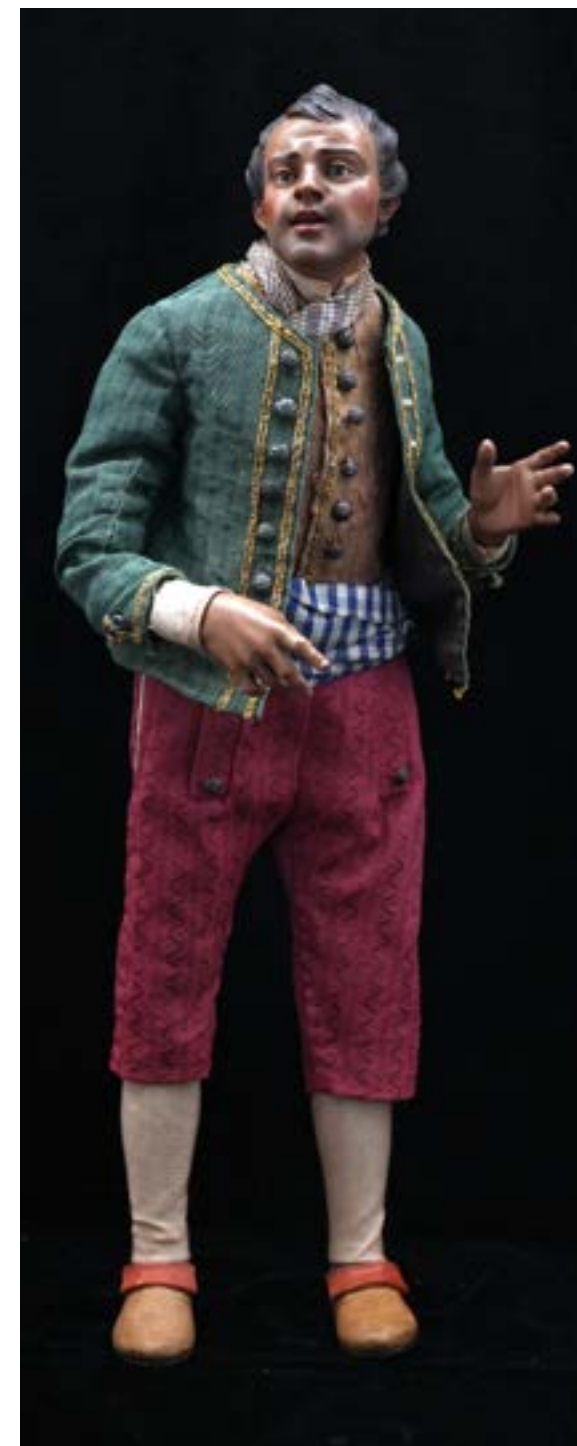
54 Mezzocarattere h cm 38 Napoli XVIII - XIX secolo Stima: € 2.000/3.000